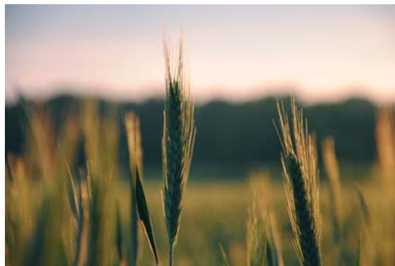
Młode wiosenne zboże