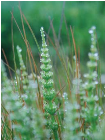
Skrzyp w rosie

1 września 2015 r. można zgłaszać zdjęcia w II etapie „LATO”. Prosimy o zwrócenie uwagi nie tylko na walory artystyczne wykonywanych zdjęć, ale również by, jak wskazuje nazwa konkursu, prezentowały one tematykę charakterystyczną dla Gminy Żabia Wola. Przypominamy, że celem konkursu jest: promocja walorów przyrodniczych i krajobrazowych gminy Żabia Wola, zainteresowanie najbliższym otoczeniem oraz zaprezentowanie piękna różnych zakątków gminy Żabia Wola.